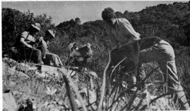
בטיול לכרמל: עוספיה-יגור (הוצאת צמחים)

כדי שידעו הילדים מהו הרכוש שעליהם לשמור, נראה להם את כל אוצרות הצומח בארץ. נפגיש אותם עם הצמחיה האנדמית והנדירה שלנו, כמו האירוסים למיניהם: א. הגלבוץ, האירוס הנצחתי, האירוס ההדור וכד". השושן הצחור, ממספח. השושנים, שהוא צמח הנפוץ בכל העולם כצמח הרבוהי ושיפחו ממנו כמה זנים הנבדלים רק במעט מהשושן המקורי שלנו. נשריש בילדים גאווה לאומית לצמחי הבר, נחדיר בהם את רעיונות "החברה להגנת הטבע", ע"י שמירה עיקבית על הצמחים שאין לקטפם, או להוציאם ולהעבירם ממקומם אלא ברשות פקחי החברה. ילמדו לתת מקום כבוד לצמחית הארץ בתוך הגן ויקפידו על נקיון וסדר בהליכתם ובנוחם בתוך נופי הארץ ודרכיה.