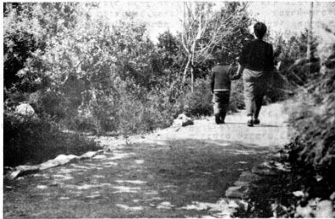
החורש הא"י ב"פינה הבוטנית" של חגן בבית החנוך גוש-זבולון "