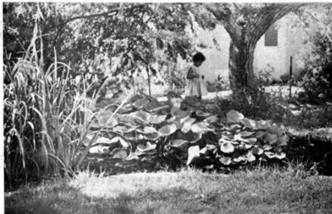
צמחית החולה, סביב הבריכה ב"פינה הבוטנית" בביה"ח, גוש זבולון "