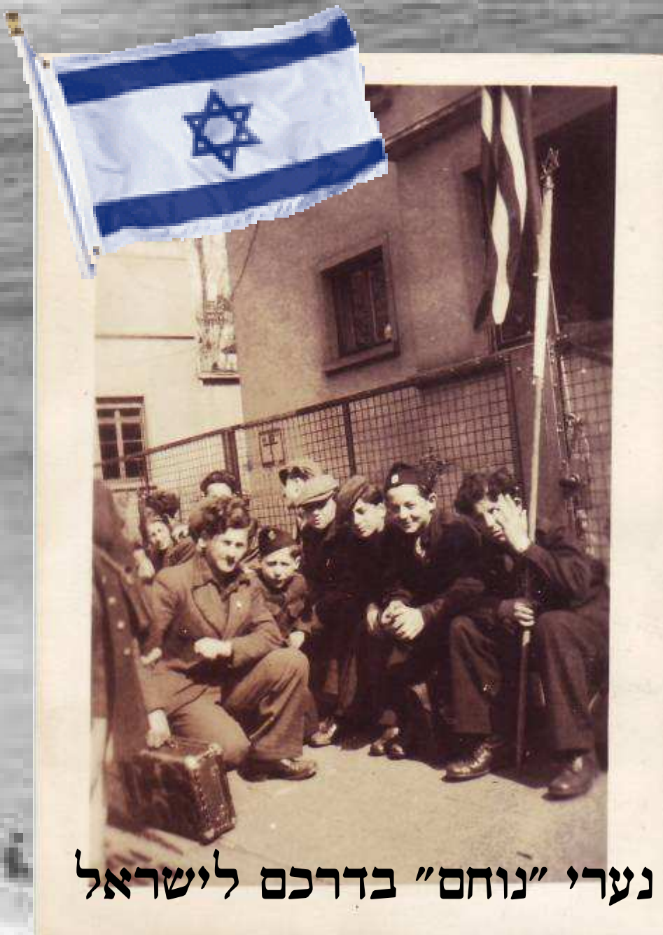
נערי "נוחם" בדרכם לישראל